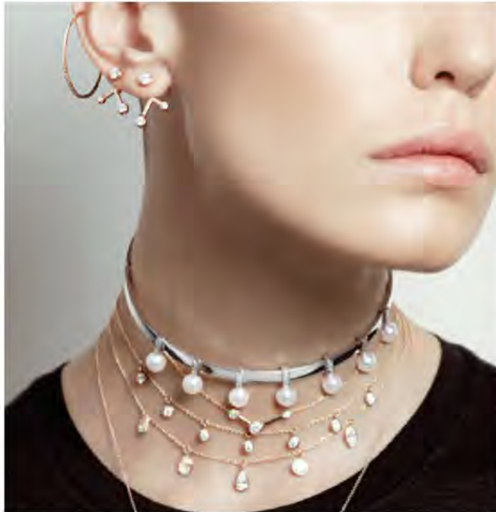
« Absolute Glam ».

L'idée était de sortir un peu des voies inaccessibles du bijou institutionnel et se mettre à la portée d'une clientèle jeune et créative, libre et qui ne se laisse pas dicter ses goûts. Avec plus de 150 ans au compteur, un savoir-faire de quatrième génération, des ateliers surdodés, une image à l'élégance affirmée et une vraie reconnaissance internationale, la maison Tabbah est une belle machine capable de réinventer