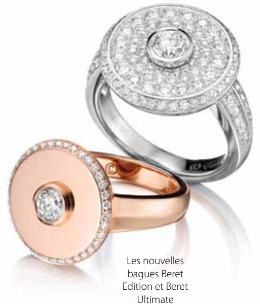
Les nouvelles bagues Beret Edition et Beret Ultimate